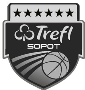
Wersja w skali szarości