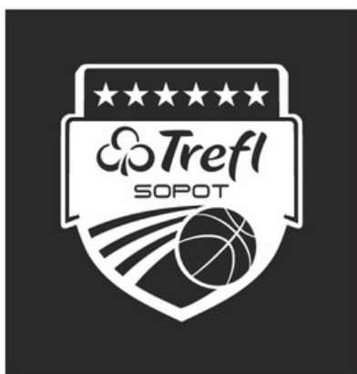
Wersja achromatyczna w kontrze

W uzasadnionym przypadku można stosować znak w wersji uzupełniającej. Należy pamiętać o respektowaniu pola ochronnego wokół znaku.